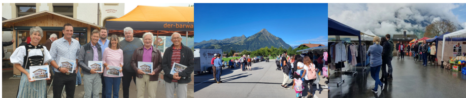
v.l.n.r.: Ehemalige Präsidenten und MA AT, Alpabzug und Floh-, Koffer- und Hobbymärit 2023

Am 13. Mai fand bei wechselnden Witterungsbedingungen der Floh-, Koffer- und Hobbymärit statt. Die Bundesfeier sowie die Jubiläumsfeier "125 Jahre Aeschi Tourismus" wurden in einem würdigen Rahmen auf dem Primarschulhausplatz in Aeschi zeitgleich abgehalten. Im Vorhinein wurden alle Mitglieder sowie ehemalige Präsidenten und Mitarbeiter/innen von Aeschi Tourismus zu einem Apéro eingeladen. Der Übergang von Sommer auf Winter wurde bei strahlendem Wetter mit einem Alpabzug mit Festwirtschaft und Markt eingeläutet. Zahlreiche Personen fanden am 16. September den Weg nach Aeschiried und begrüßten beim Parkplatz die Älpler.